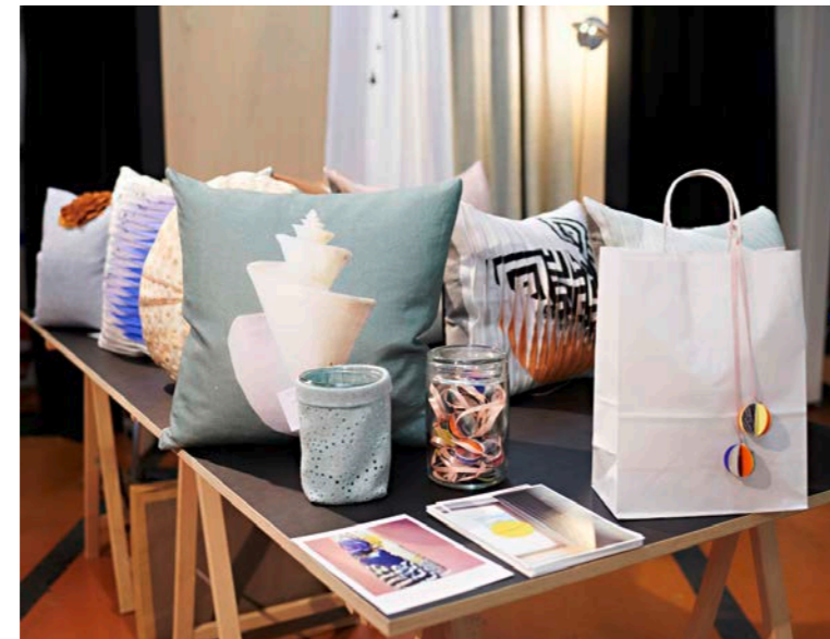
(Schweizer) Design zum Verschenken.

ORIGINELL und hübsch soll es sein, aber bitte auch nützlich, das perfekte Weihnachtsgeschenk. Vielleicht entdecken Sie dieses ganz überraschend in einem ehemaligen Industrieareal: Vom 6. bis 8. Dezember findet in der Viscosistadt in Emmenbrücke das Festival «Design Schenken» statt: Über hundert Labels zeigen ihre Designprodukte. Mit kostenlosem Hort im Kinderatelier Akku. designschenken.ch