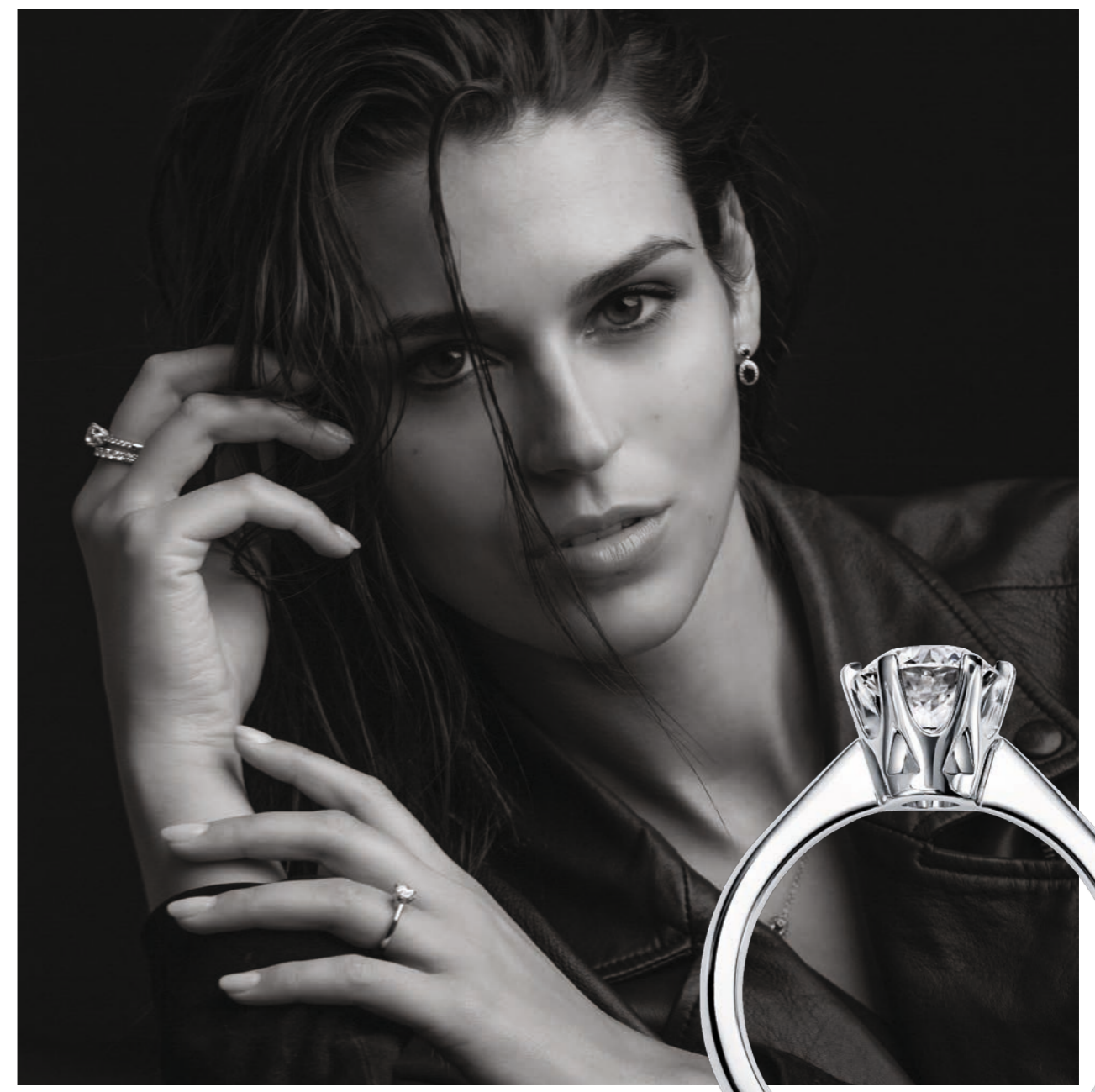
Diamant-Spitzenqualitäten | Exklusives KURZ Design